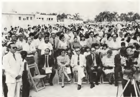
Anualmente e pueblo de Aruba ta recorda e inauguracion di nos Himno y Bandera. E celebracion aki ya a bira un manifestacion cultural di un y tur, tanto grandi como chiquito.

Ta deseo di Gobierno y Instituto di Cultura di Aruba pa pueblo di Aruba lo sigi coopera pa di e forma aki engrandecé e folklore y cultura di Aruba.